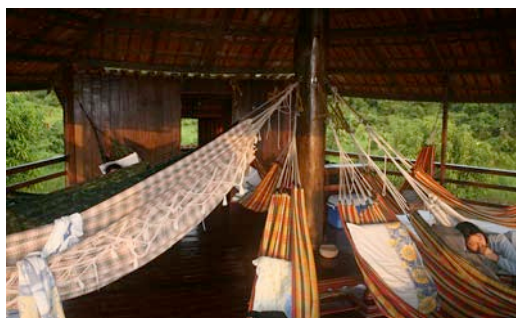
Bangalô do Mirante