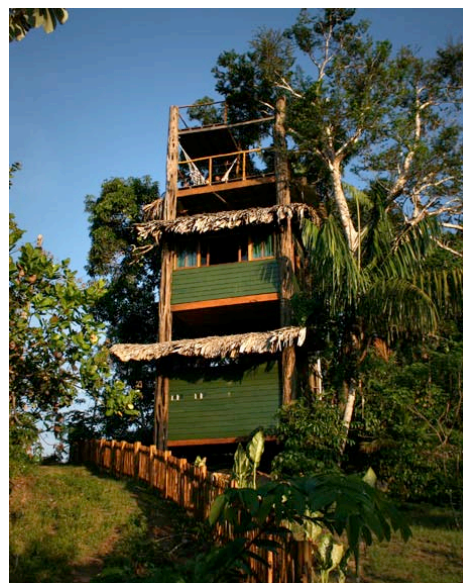
Mirante do Gavião em Novo Airão