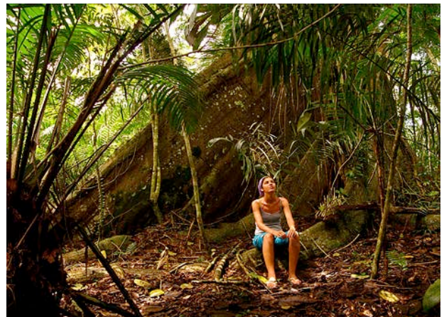
Samaúma – Parque Nacional do Jaú