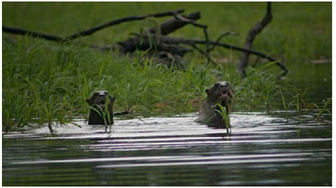
Ariranhas no igarapé do Sobrado