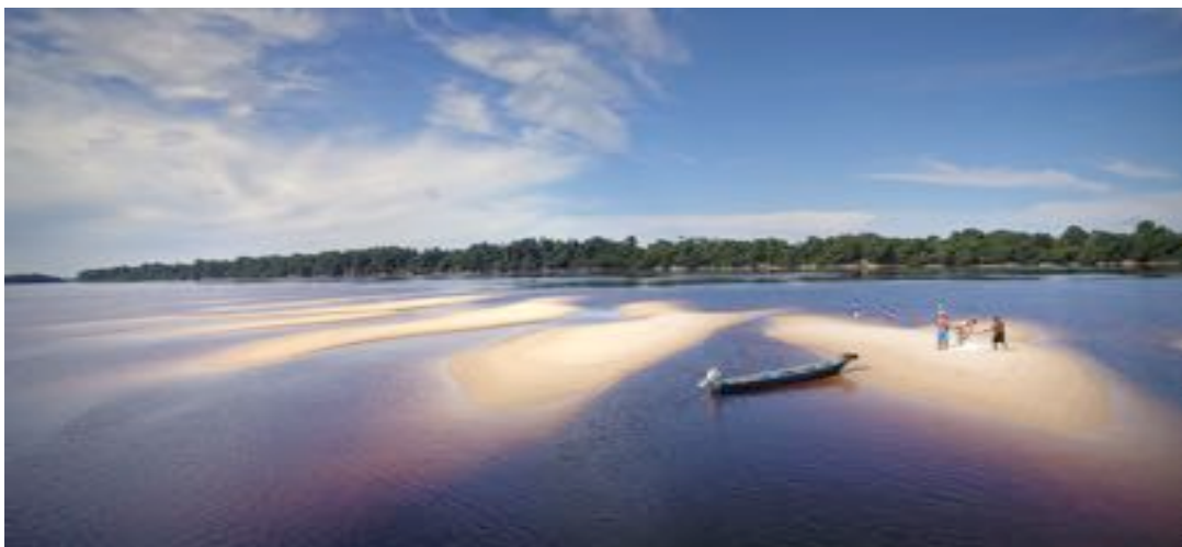
Praias de Anavilhanas

Em consonância com a deliberação normativa nº 161 de 09 de Agosto de 1985, da Embratur, em caso de desistência após emissão do Voucher, com até 41 dias de antecedência, será retido 10% do valor total a título de despesas operacionais e bloqueio da embarcação. Caso a desistência ocorra de 21 a 40 dias do início da viagem, será retido 50% do valor total. Caso a desistência ocorra após os 20 dias anteriores ao embarque, será retido 80% do valor do pacote. Ressaltamos que nossas tarifas derivam da política do justo valor, e são a composição da logística fluvial móvel da Amazônia, gastos com combustível, programa de manutenção, tripulação especializada, alimentação de primeira qualidade, passeios, atrações e toda infra-estrutura necessária para uma viagem tranquila e segura. Ademais, o que oferecemos a nossos clientes é a genuinidade que somente o turismo móvel é capaz de proporcionar , levando-os aos acontecimentos espontâneos in loco, sejam eles naturais ou humanos.