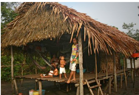
Tapiri, a casa do caboclo amazonense