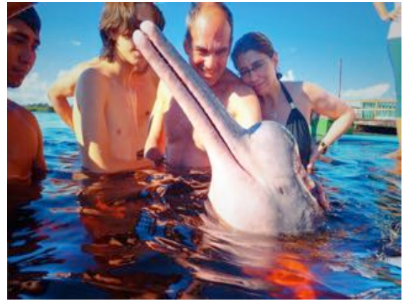
Interação com Botos no Rio Negro