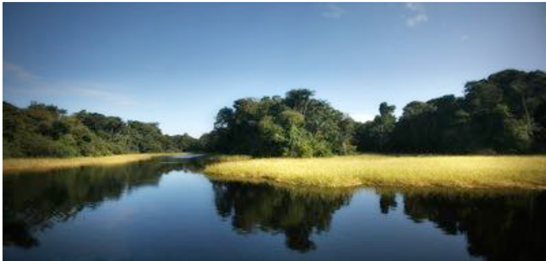
Lagos do Arquipélago de Anavilhanas