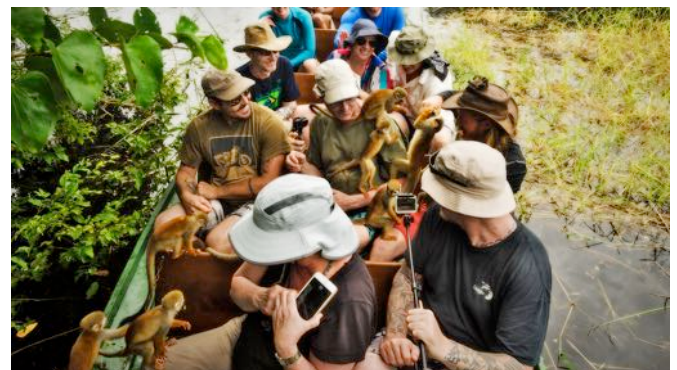
interação com macacos de cheiro