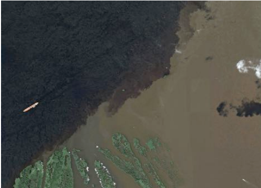
Vista aérea do encontro das águas