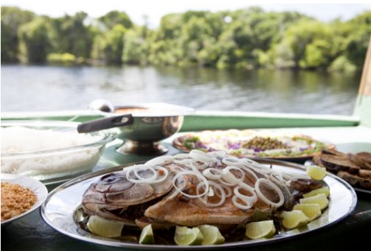
Tambaqui assado na brasa