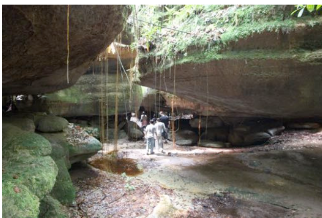
Salão nas grutas do Madadá