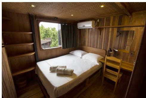
Cabine do Jacaré-Açu