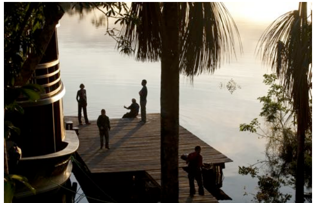
Pier no Mirante do Madadá