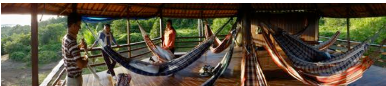
Bangalo no Mirante do Madadá, para pernoite na selva (opcional incluso)